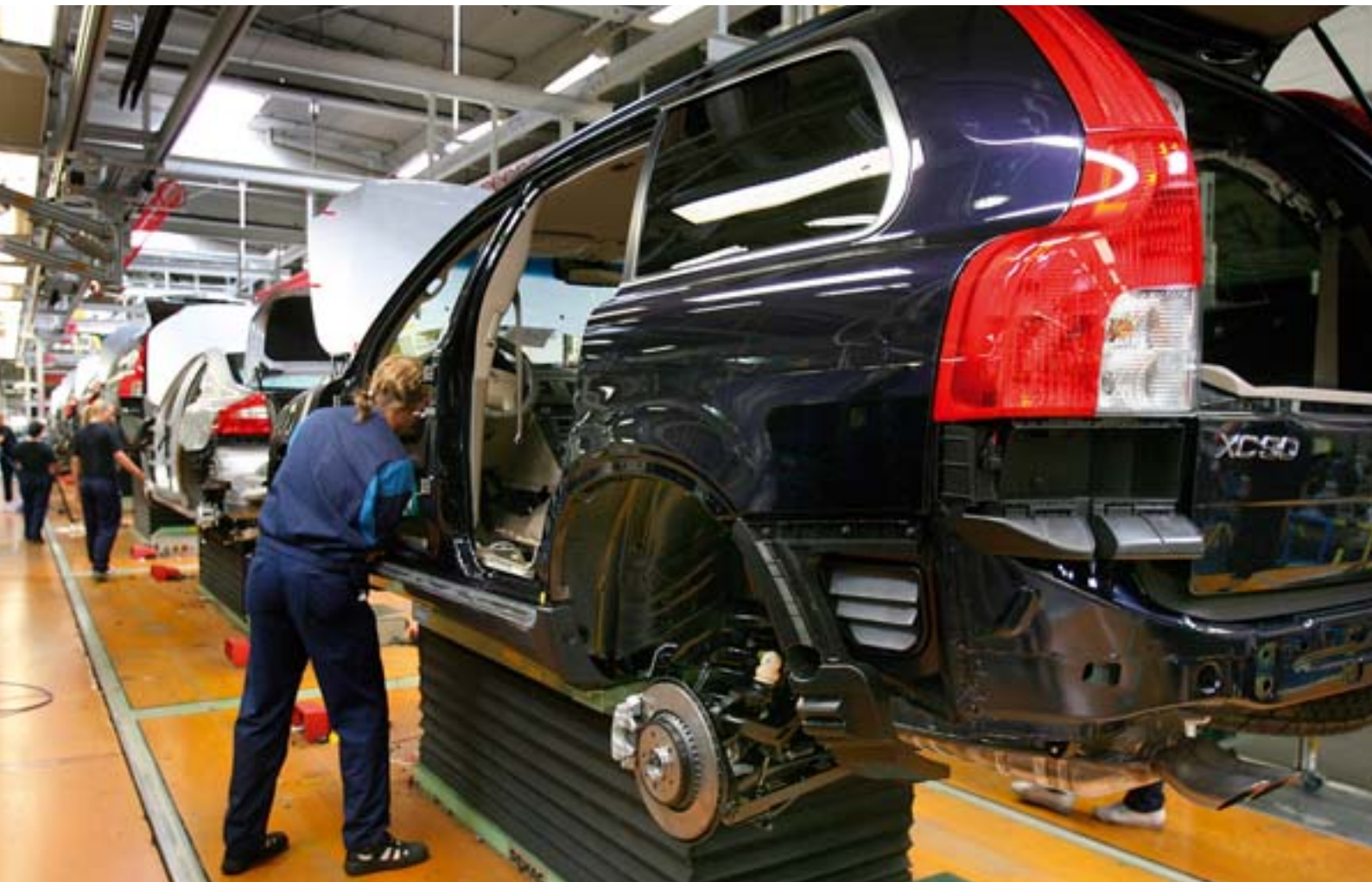
ПРОИЗВОДСТВЕННАЯ ЛИНИЯ АВТОМОБИЛЬНОЙ КОРПОРАЦИИ ВОЛЬВО.

Mirka, мировой лидер в прогрессивных абразивных технологиях, предлагает вам универсальные решения для процессов шлифования. Наш широкий ассортимент включает продукты, идеально соответствующие требованиям работы со всеми материалами, используемыми в современной автомобильной индустрии, включая сталь, оцинкованную сталь, алюминиевые сплавы и композитные материалы, такие как карбонатное волокно и стекловолокно.