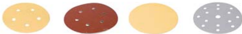
Традиционные материалы на бумажной основе.

■ Современные передовые автомобильные покрытия являются технически высококачественными, износостойкими материалами, хорошо сохраняющими блеск. Это предъявляет очень высокие требования и к абразивам, предназначенным для работы с этими материалами. Mirka уже длительное время работает в тесном взаимодействии с основными производителями покрытий для автомобильной промышленности. Такое постоянное сотрудничество обеспечивает шлифовальным материалам Мирки поддержание оптимального качества (например, идеальная шероховатость поверхности и уровень агрессивности абразива) для каждой конкретной шлифовальной операции на производстве.